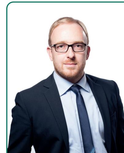
Matteo Maciotti Sindaco di Chiampo