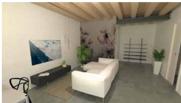
ED108: ARZIGNANO - appartamento bicamere sito al primo ed ultimo piano, con terrazzo abitabile e garage doppio