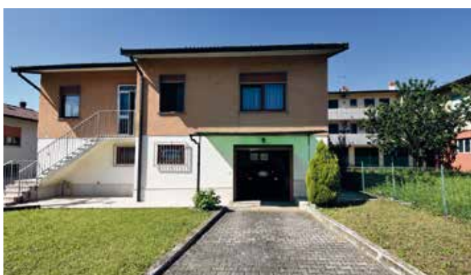
MDD090: VILLAGGIO GIARDINO - casa singola dalle ampie metrature con grande giardino privato

Sul nostro sito trovate tutti i nostri immobili in vendita www.myhomeimmobiliare.it