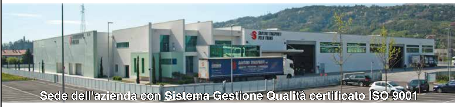
Sede dell'azienda con Sistema Gestione Qualità certificato ISO 9001

Recapito: Bertini Trasporti 20161 MILANO - Via Nicolodi, 15 Tel. 02 66200069 Fax 02 66202820