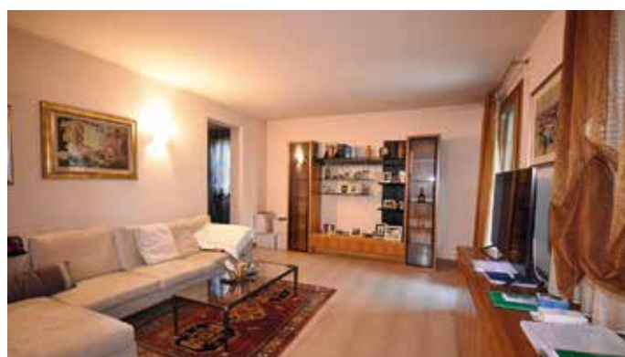
ED176: ARZIGNANO - appartamento tricamere con giardino al piano terra, e garage e cantina al piano interrato