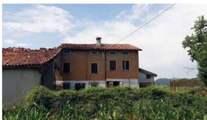
GD-220: MONTECCHIO MAGG. - soluzione di abitazione singola con esterno di pertinenza completamente da ristrutturare, con possibilità di creare due unità abitative