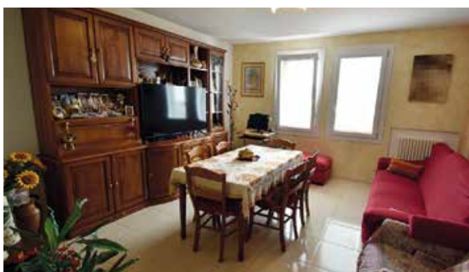
GD-218: ARZIGNANO - appartamento tricamere dalle ampie metrature, al piano terra troviamo garage e cantina