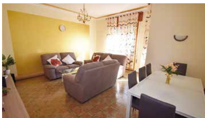
GD-217: ARZIGNANO - appartamento tricamere in condominio centrale, con garage e cantina