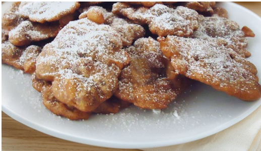
Ricetta e immagine tratte da: www.fattoincasadabenedetta.it

Ingredienti (per 4 persone): 100 gr farina di castane, 200 ml acqua, olio di semi q.b., zucchero semolato q.b.