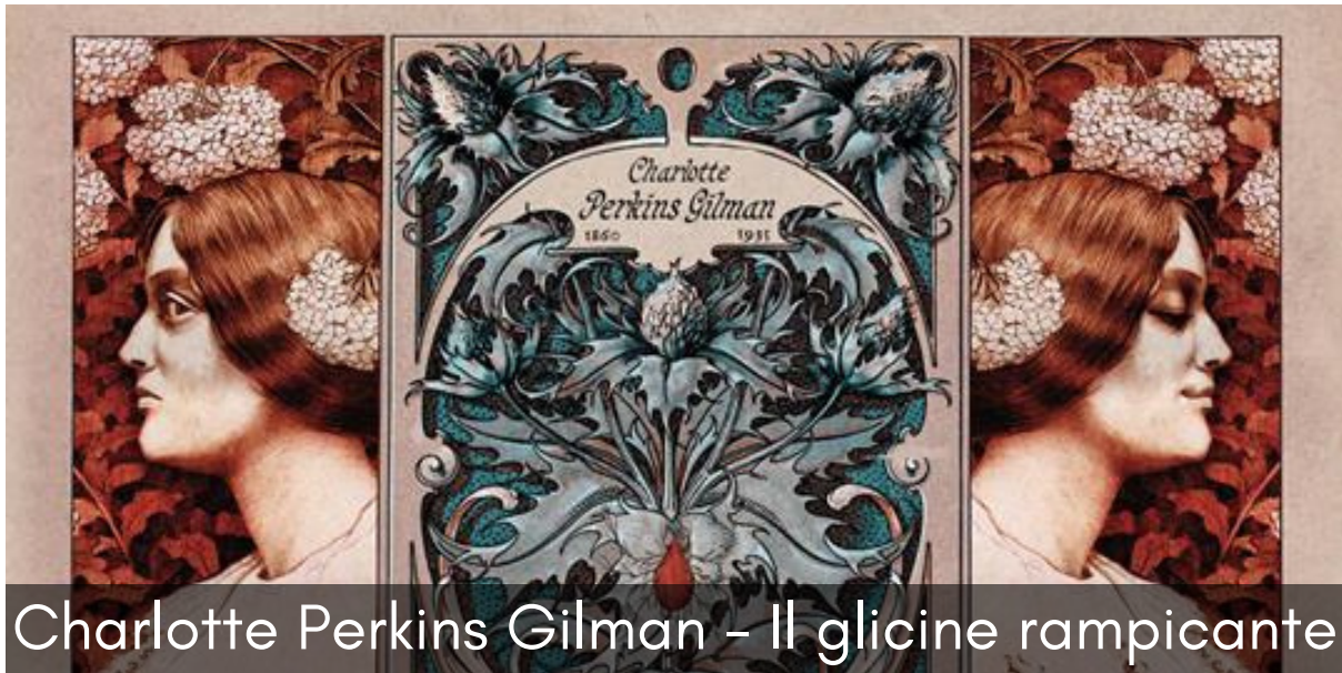
Charlotte Perkins Gilman – Il glicine rampicante

Nota ai più per " La carta da parati gialla ", Charlotte Perkins Gilman è stata una prolifica scrittrice di racconti gotici... e femministi!